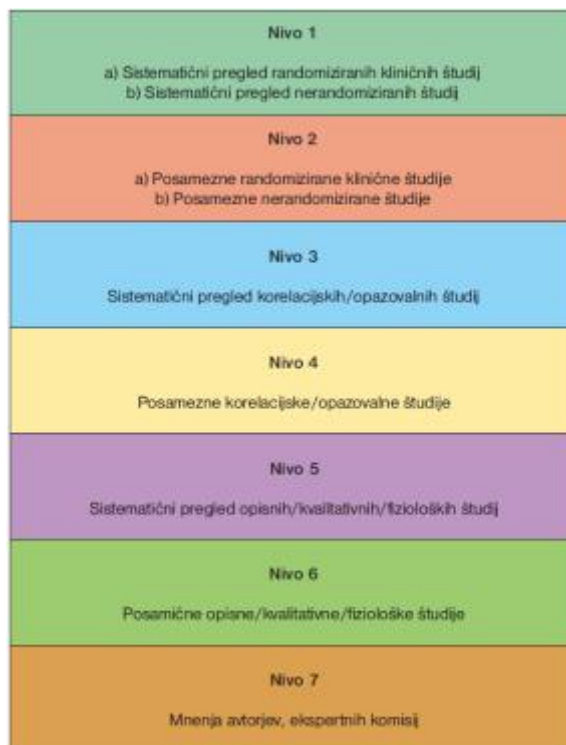
Slika 1: Hierarhija dokazov v znanstveno-raziskovalnem delu

Kakovost dobljenih virov smo uvrstili v končni pregled literature in jih ocenili po hierarhiji dokazov (Slika 1) (Polit & Beck, 2010). Nivojev je sedem, in sicer si sledijo po kakovosti od ocene 1, ki je najbolj kakovostna, do 7, ki je najmanj kakovostna. Oceno kakovosti pregleda smo predstavili shematsko in opisno.